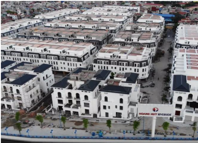
Dự án Hoàng Huy Riverside

Trong tháng 10, công ty tiếp tục bàn giao các căn hộ khác của Dự án Hoàng Huy Riverside và những căn hộ đầu tiên của Dự án Gold Tower cho khách hàng.