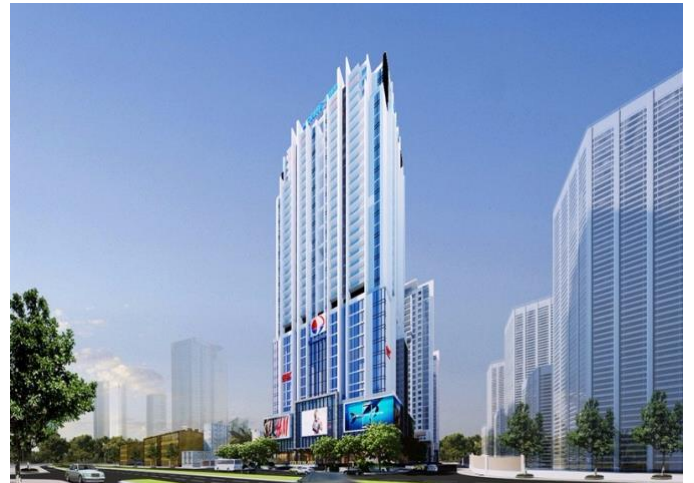
Dự án Gold Tower

Cũng trong cuối tháng 10 vừa qua, TCH đã thông qua chủ trương thực hiện đầu tư dự án mới Hoàng Huy Plaza (199 Tô Hiệu, Quận Lê Chân, TP Hải Phòng) với tổng vốn đầu tư dự kiến 834 tỷ đồng. Dự kiến các thủ tục để sẵn sàng đầu tư sẽ hoàn thiện ngay trong năm 2019.